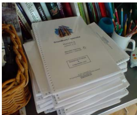
Linguaweb en colaboración con la escuela Nyköpings Friskola , Suecia.