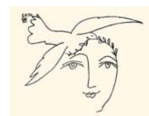
Hombre por la paz