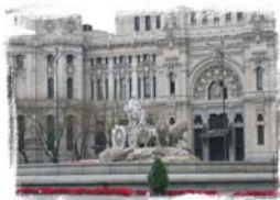
La Cibeles, Madrid.