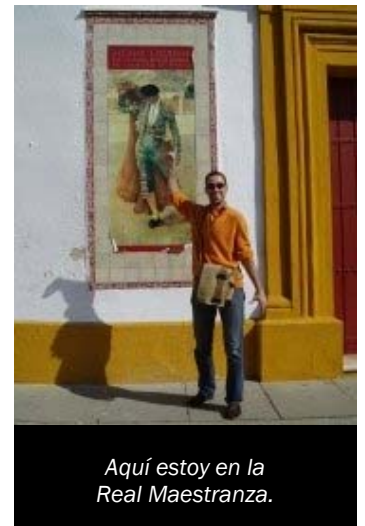
Aquí estoy en la Real Maestranza.

fuera), el barrio de Triana y desde el coche vimos la Isla de Cartuja (pero había una carrera y muchas calles cortadas así que no pudimos bajar). Calor, bastante, el sábado con manga corta y el domingo "refrescó", si se puede utilizar la palabra. Tendremos que escaparnos otro fin de semana para ver el resto.