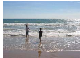
El agua está muy fría.