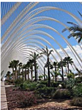
Umbracle. Ciudad de las Artes y las Ciencias de Valencia.

¿Te apetece escribir a ti también? ¿Quieres ser periodista por un día? Si deseas participar, envía tu texto en español a newsletter@linguaweb.com